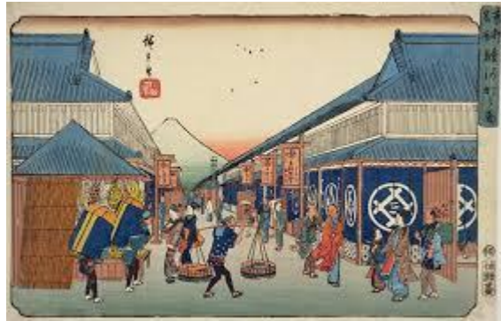
↑ 駿河町（富士之図） ↓