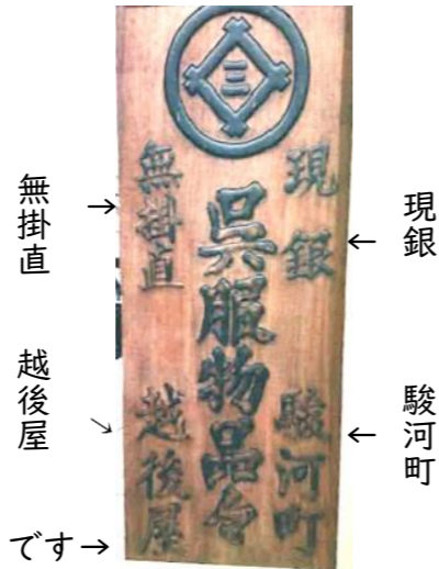
無掛直 → ← 現銀 越後屋 ↓ ← 駿河町