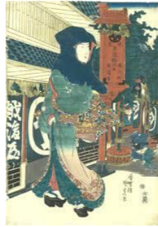
↑ 越後屋前の三美人の一人。 「現銀掛け値なし」の看板は浮世絵にも描かれています。