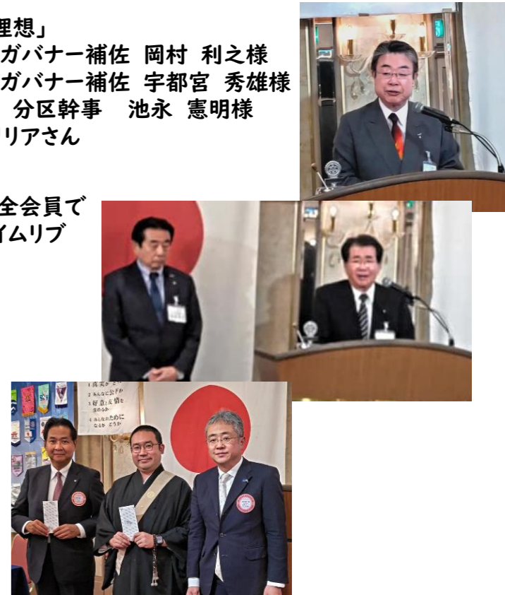
例会報告は裏面に続きます。